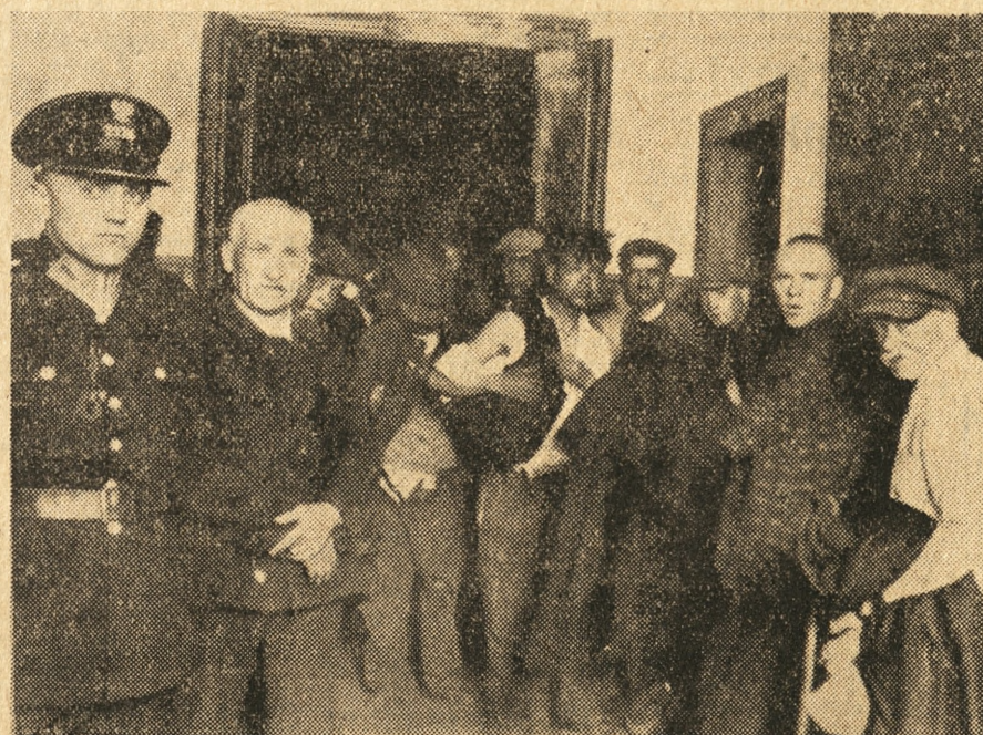
„Światowid” nr 401 (16) z 16 IV 1932 r. Schronisko w Warszawie przy ul. Dzikiej dla bezdomnych nędzarzy, zwane przez nich „Cyrkiem”

Niewiele czasu dzieli nas od zimy. Śnieg pada, zakryła już niebawem dzieci oczekujące rozrywek, jakie niesie nowa pora roku. „Śnieg pada!” powiedzą do rośli, nie wiedząc, co oznaczało to przed wojną dla setek głodnych, obdartych nędzarzy.