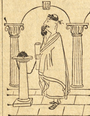
— Halo! Czy to Forum MDCCLXII?

Jeśli dla przykładu wziąć pod uwagę plan pracy Komisji Rolnej w gminie Jarocin, wówczas nie trudno będzie wywnioskować, jakie ważne zadanie ma ona do spełnienia. Oprócz kontroli działalności POM-u Państwowych Gospodarstw Rolnych i spółdzielni produkcyjnych w zakresie przygotowań i wykonywania nalożonych na nie obowiązków oraz udzielania im pomocy, członkowie tej komisji zajmują się m. in. sprawą likwidacji odlogów w Radlinie, zelektryfikowaniem gromad: Anopol, Bachorzew i Tarce, rozwojem hodowli trzody chlewnej oraz przyspieszeniem odstaw i wpiat.