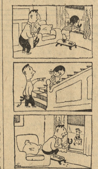
Historia bez słów

W przyszłości będą się wystrzechać takiego konfliktu i zabiorę z sobą termos z wodą sodową. Będę siedział przy stole samousługowym. Dowidzenia. Sowidzrał