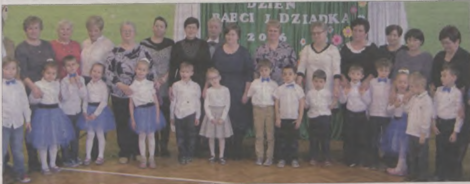
Wyszyńskie przedszkolaki wraz z babciami i dziadkami.

Dzień Babci i Dziadka, choć spóźniony o miesiąc, ale uroczysty przygotowały niedawno przedszkolaki ze szkoły w Wyszyńcu.