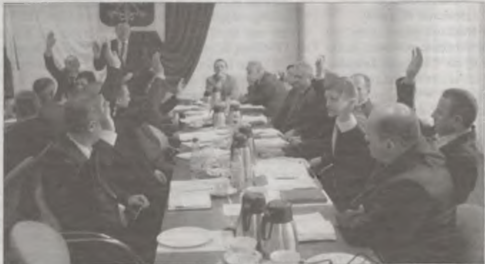
Radni nie we wszystkich byli zgodni.

Kanalizacja nie dla SZU Na podstawie kalkulacji sporządzonej przez Spółdzielczy Zakład Usługowy w Przykonia, Rada Gminy podjęła uchwałę o wysokości stawek zbiorowego zaopatrzenia w wodę, które są jednymi z najniższych w powiecie tureckim. Gospodarstwa domowe zapłacą od