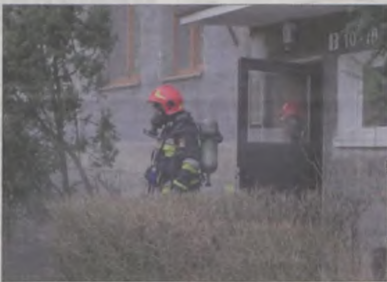
Budynek był bardzo zadymiony, więc strażacy gasili pożar w aparatach chroniących drogi oddechowe.