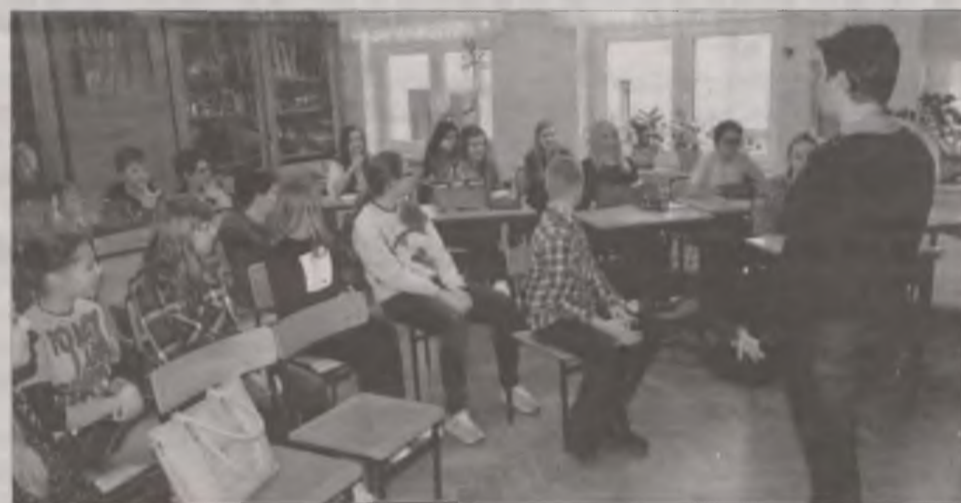
Wspólna lekcja dla uczniów podstawówki i gimnazjum? Czemu nie.

klasistów, którzy czynnie brali w niej udział. boxa