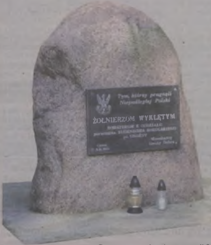
Czy wszyscy zasługują na pomnik?

Paweł Janicki ps. śródtytuły pochodzą od redakcji