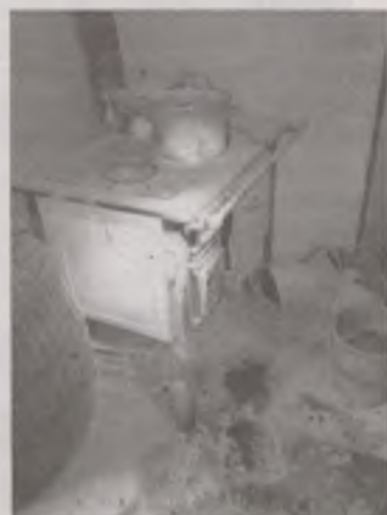
Zarzewie ognia wypadło z kuchni węglowej, w pokoju jednego z lokatorów budynku socjalnego przy Polnej.

Jednak zabezpieczenia niewiele dają. Rok po tym, jak wprowadzili się do wyremontowanego budynku, w czwartek, 18 lutego, doszło tam do kolejnego pożaru. Śwąd dymu, podobnie jak poprzednim razem wyczuła jedna z lokatorek. Kobieta zadzwoniła po strażaków. Okazało się, że w jednym z pomieszczeń z kuchni węglowej wypadła podpałka. Podłoga spełniła swoją rolę i nie zajęła się ogniem, ale powstał gęsty dym, który zaalarmował sąsiadów. Mężczyzna, w którego mieszkaniu doszło do zdarzenia był pod wpływem alkoholu, jednak jeszcze na tyle świadomy, że zaczął gasić zarzewie ognia podręczną gaśnicą. Strażacy je dogasili i przewietrzyli budynek. Budynek jest pod stałym nadzorem strażaków, a także pracowników komunalki i policjantów.