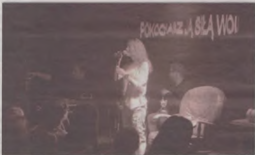
Aranżacja spektaklu zrobiła wrażenie na publiczności.