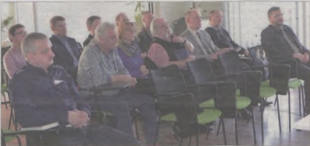
Choć na spotkanie, które odbyło się w Tureckim Inkubatorze Przedsiębiorczości przyszło niewiele osób, dyskusja była bardzo owocna.

Podczas środowego (17 lutego) spotkania policjantów z mieszkańcami, niestety zabrakło tych drugich! Być może dlatego, że konsultacje