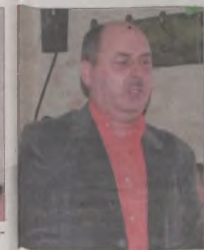
Sołtys Wincenciak za karaniem kierowców przekraczających prędkość, ale jadących pojazdami z obcymi numerami rejestracyjnymi.

to określili „średniego Gierka”. Nie omijają też plebanii i strażnic OSP. Kradną między innymi paliwo z samochodów strażackich co może skutkować niemożnością wyjazdu do pożaru. -Złapałbym takiego delikwenta, podpaliłbym pod nim ogień i umieścił gaśnicę dwa metry od niego. Mnie skradziono przed laty silnik od beloniarki. Policja złapała tych przestępców, ale co z tego. Oni przyznali