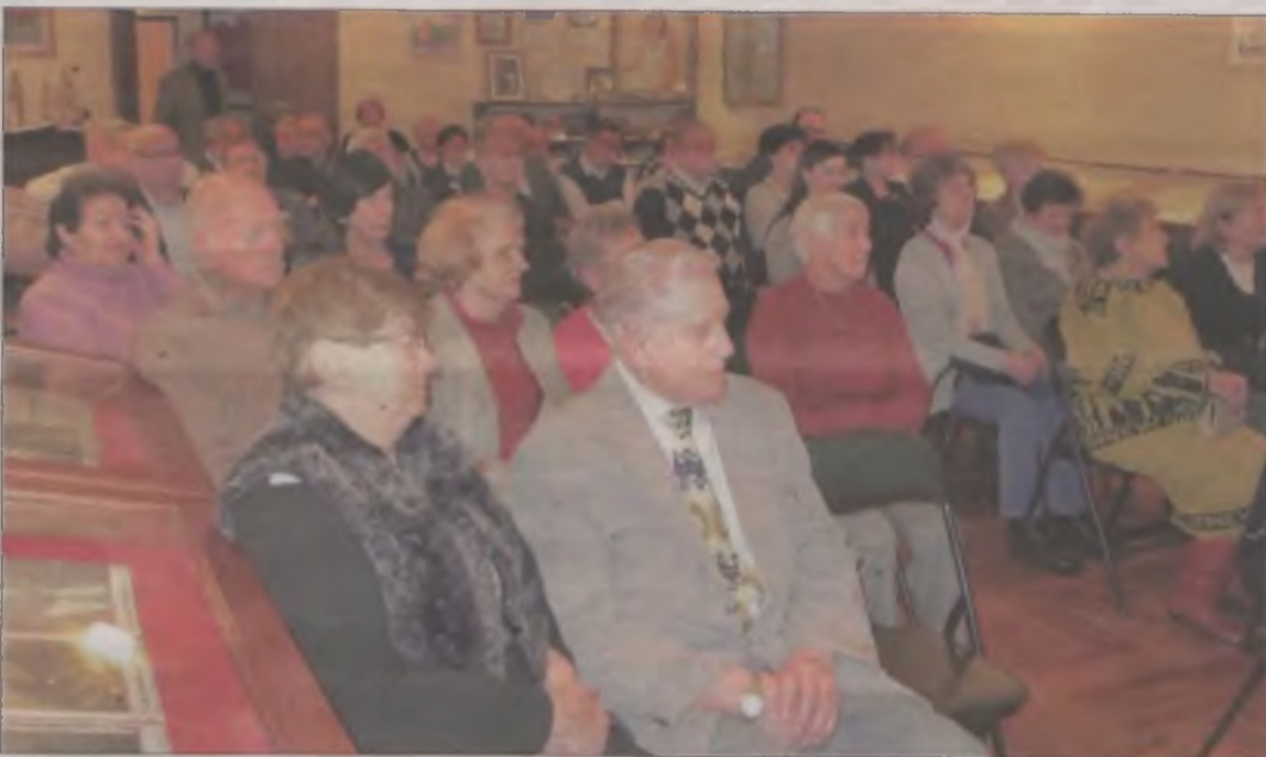
Na pierwszy pokaz zaproszono związanych ze stowarzyszeniem i tych, którzy aktywnie działali w 1990 roku. Wiele osób miało ochotę wrócić na chwilę w przeszłość Uniejowa.

Symfonia westchnień, wykrzyknień, rozpoznań, wzruszeń. A ja, w ostatnim rzędzie – skupiona – myślę o tym, że zazdroścę zgromadzonym ciągłości historii i wspólnoty. Tego, że od pokoleń budują miejsce, że mogą być rozpoznani na taśmie filmowej, że mają pamięć miejsca, że nie są anonimowi, jak ja – ktoś z wielkiego miasta. Wieczory filmowe organizowane przez Towarzystwo Przyjaciół Uniejowa, stanowią wyjątkową okazję, żeby spotkać się z ludźmi, którzy przez lata, budowali i budują tkankę miasta Uniejów. To czas dzielenia się doświadczeniami i wspomnieniami. To czas, który w wyjątkowy sposób może pokazać jak każdy mieszkaniec, bez wyjątku, jest ważnym ogniwem łączącym naszą wspólną pamięć miejsca.