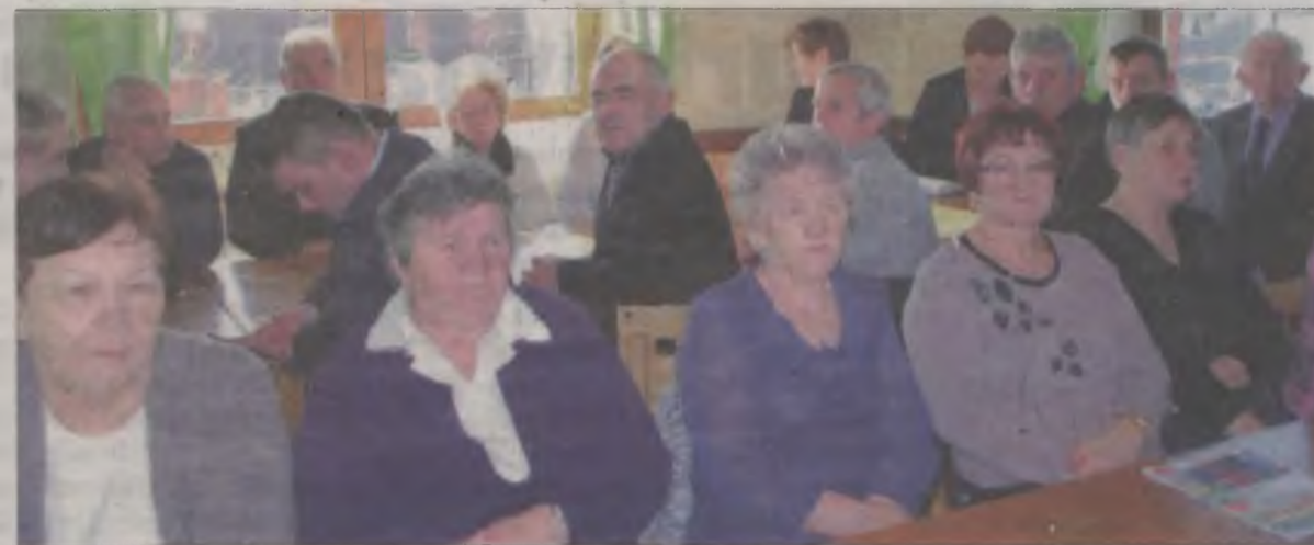
Na zaproszenie wójta odpowiedziały 62 osoby.