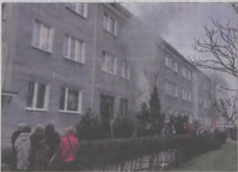
Przyczyną pożaru w piwnicy bloku przy ulicy Smorawińskiego było podpalenie przez nieznaną osobę.