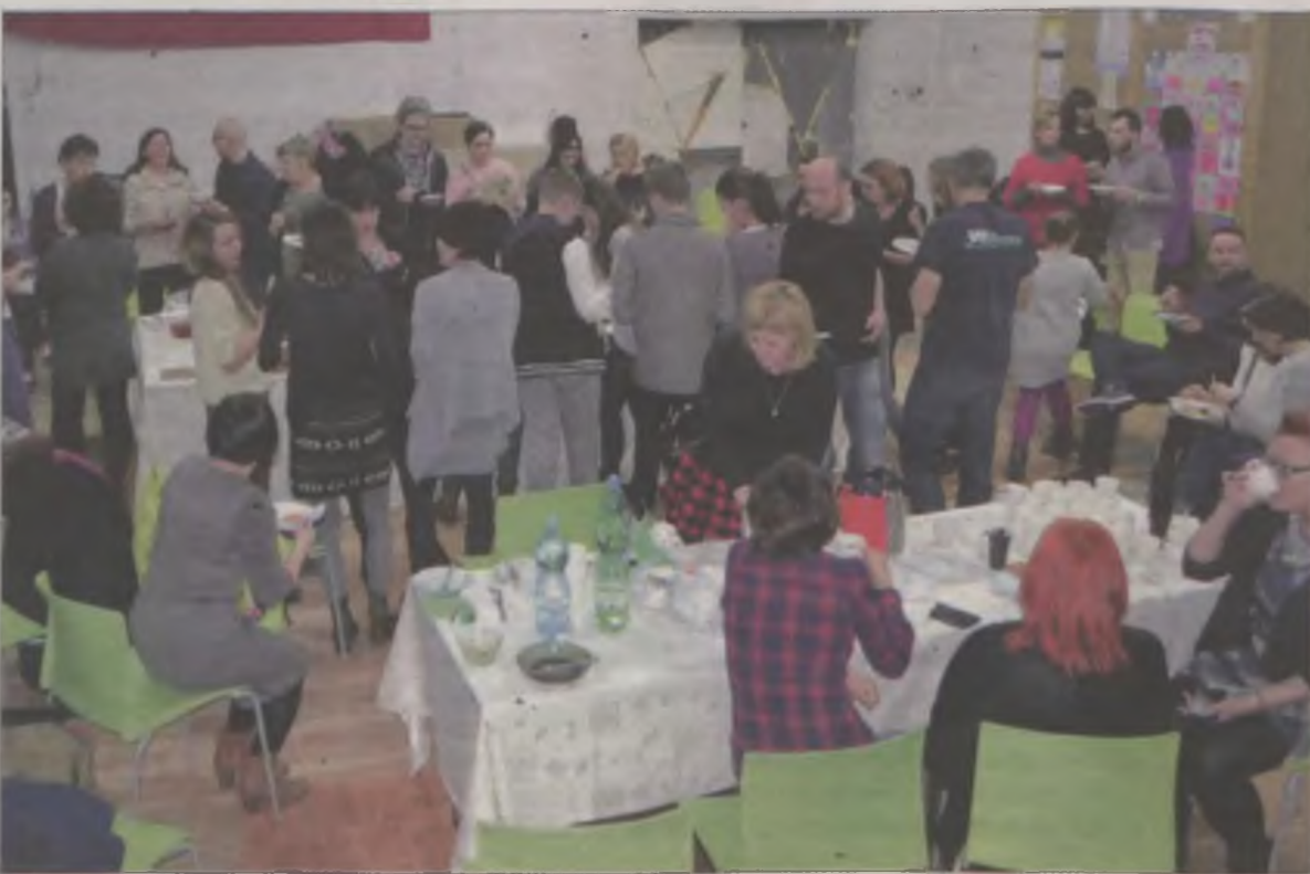
W minioną niedzielę Przystać odwiedziło kilkadziesiąt osób. Nikt nie wyszedł głodny.