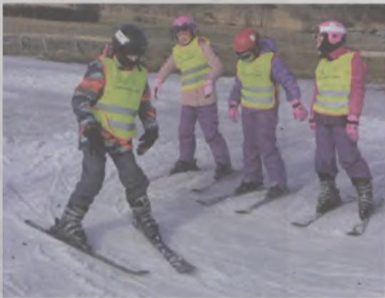
Początki narciarskiej edukacji nie są najłatwiejsze.

Dla uczestników białej szkoły przygotowano wiele konkursów plastycznych, w których bardzo chętnie brali udział. Projektowali plaketkę „Biała szkoła 2017”, malowali plakat pod hasłem „Bezpieczny stok” i kartkę pocztową z gór. Odbył się także konkurs językowy „Przepis na danie