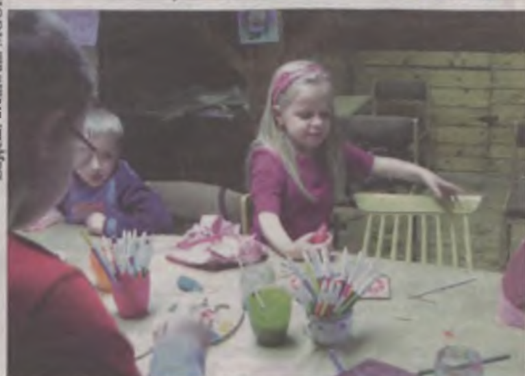
Zajęcia: archiwum MGOK w Uniejowie