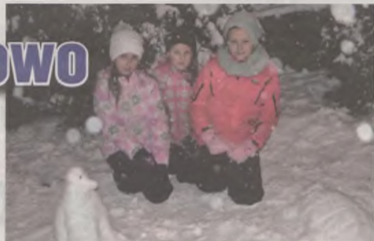
Młodzi mieszkańcy przykońskich bezśnieżnych nizin mogli nacieszyć górską zimową aurą.

regionalne w języku angielskim”. Oprócz zajęć sportowych na stoku nie brakowało także innych: tenisa stołowego, bilardowy, darta, szachowy i warcabowy. Zwycięzcy wszystkich konkursów i turniejów zostali nagrodzeni dyplomami i pamiątkami z gór.