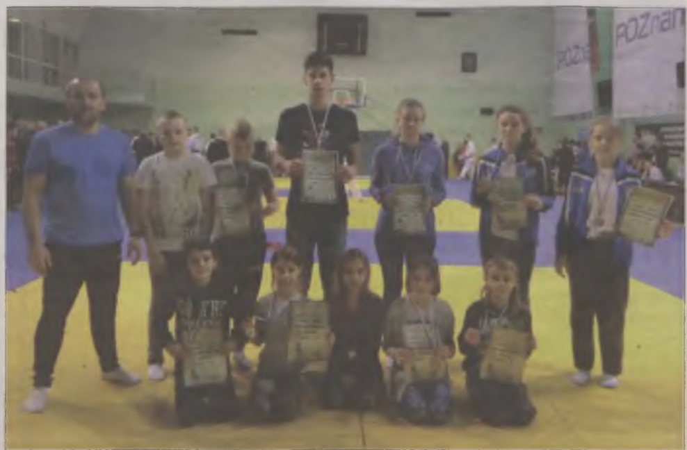
Ekipa judoków z Tuliszkowa podczas mistrzostw w Poznaniu.