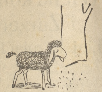
Była owieczka łagodna, ufna — tak bajka się zaczyna —