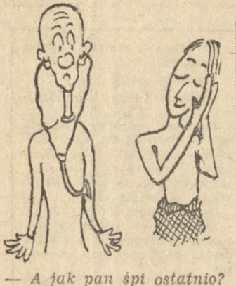
— A jak pan śpi ostatnio? — O tak, panie doktorze.