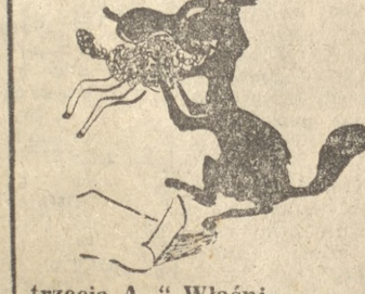
trzecia A...” Właśnie przy trzeciej nucie — zgrzył owcę z apetytem.