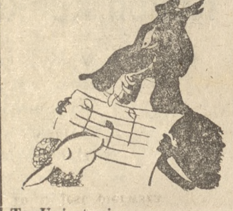
To U jest pierwsza za wiolinowym kluczem.