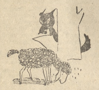
przyszedł wilk i gra rolę wilka ów nauce zwieryny.