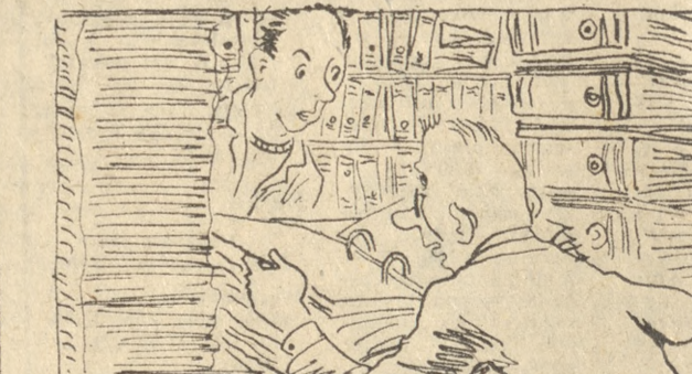
— Kiedy się dowiem czegoś bliższego o moim pomysle racjonalizatorskim? — No... wkrótce! Przyjdź pan za rok... dwa...