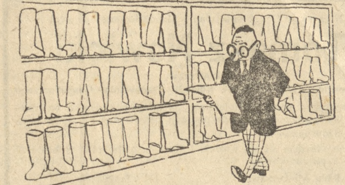
— Co? Koledzy żądają pilnie 10 par butów gumowych? Nic z tego! — jutro przyjeżdża komisja rewiżyjna, nie będę psuł tak ładnej wystawy!