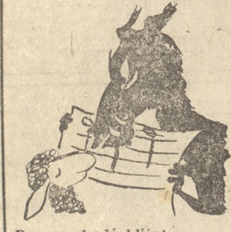
Druga, chodź bliżej i nie nie bój się, S druga stoi przy tem,