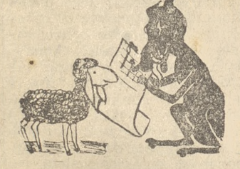
„Czy znasz ty nuty” Nie — owca beczy. „To poznasz, ja nauczę. Lecz zamknij oczy.