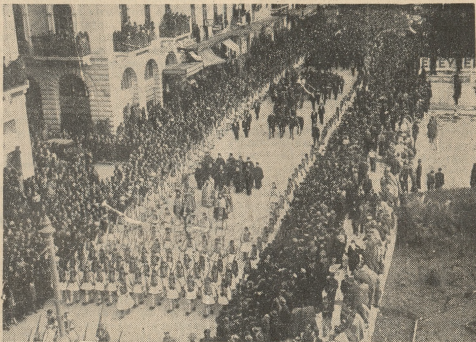
Kondukt żałobny ze szczątkami b. regenta Grecji generała Kondylisa kroczy ulicami Aten na dworzec Larissa.