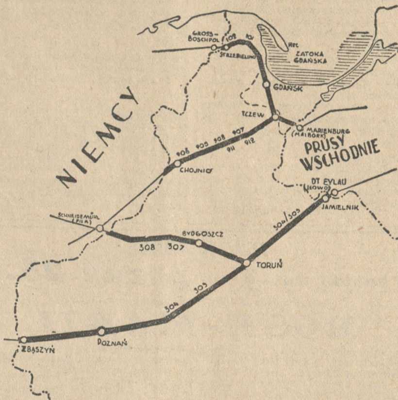
Szlaki skasowanych siedmiu par pociągów tranzytowych

Wreszcie na podstawie art. 1 konwencji dodatkowej berlińskiej otwartą nową linią kolejową dla tranzytu uprzywilejowanego, a mianowicie: